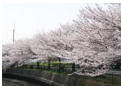
◆満開を迎えた事業所近くの桜並木

する中で一番心がけている事は、「介護」という基本は守りつつ、お互いが思いやりをもち楽しく過ごす☆事です。決してキレイ事だけでは済まない状況があるとはいえ、この心がけで、おのずと楽しい〜優しい〜環境が出来上ってくるのだと思います。立地環境については自然があふれ、北越谷駅から徒歩6分という好立地な環境。居住環境としては街中でもなく、田舎でもない本当に住みやすい環境にあると思います。用事がないと立ち寄りられる機会はないと思えますが…是非一度、遊びに来てください。施設みんなでお待ち申し上げております。